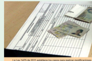
La Ley 1475 de 2011 establece los casos para realizar modificaciones a

De acuerdo con el Artículo 31 de la Ley 1475 de 2011, la inscripción de candidatos a cargos y corporaciones de elección popular sólo podrá ser modificada antes de la aceptación de la candidatura o de renuncia, dentro de los cinco días hábiles siguientes a la inscripción de las correspondientes inscripciones".