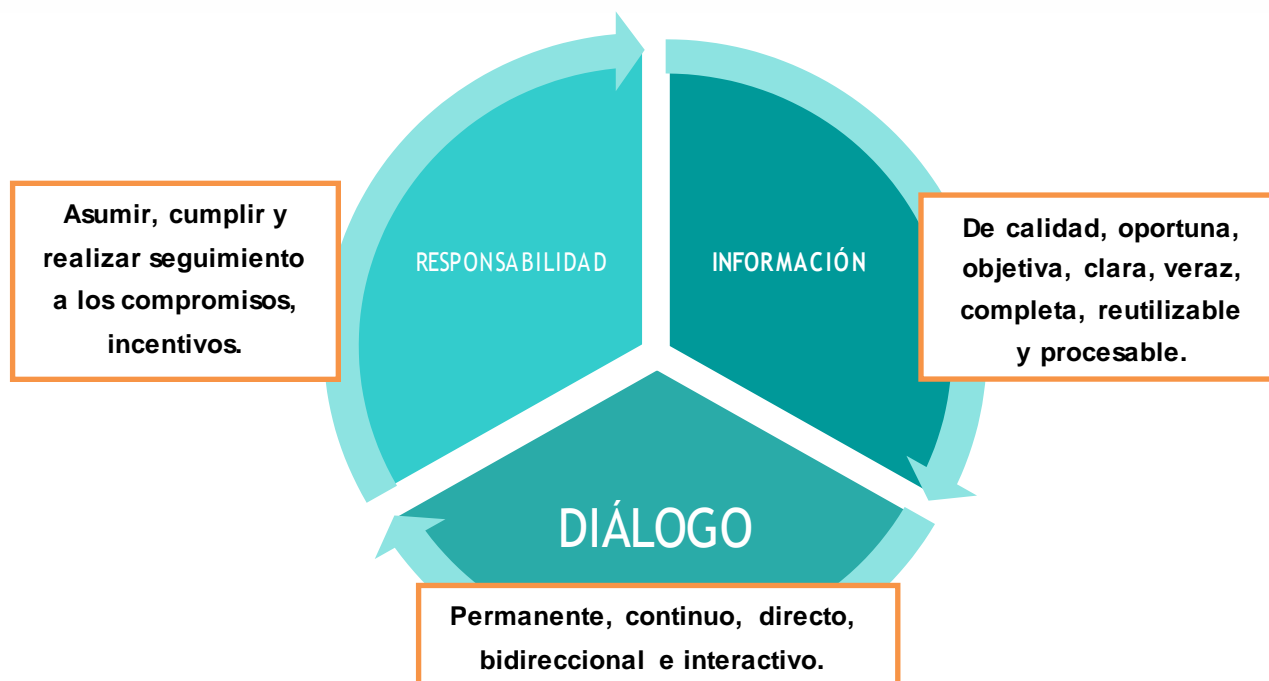
Ilustración 1. Componentes de la Rendición de Cuentas