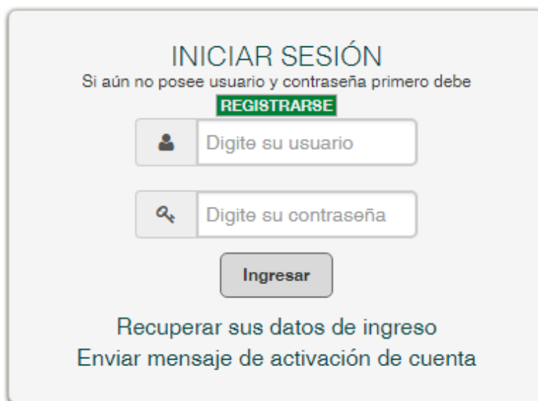
ILUSTRACIÓN 6. INICIAR SESIÓN

Podrá iniciar sesión con las credenciales de acceso, usuario (número de identificación) y contraseña, enviadas a la dirección de correo electrónico registrada: