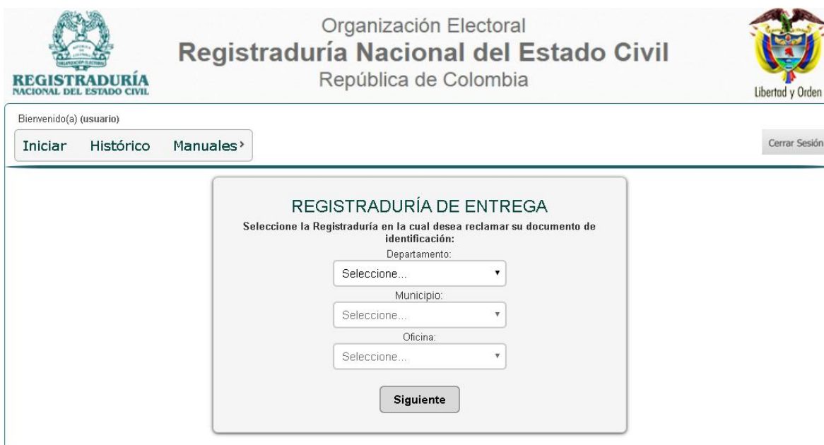
ILUSTRACIÓN 12. REGISTRADURÍA DE ENTREGA

Deberá seleccionar la Registraduría donde desea reclamar el duplicado del documento de identidad: