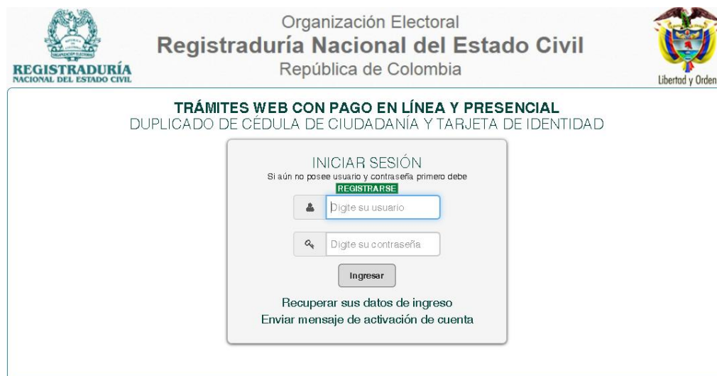
ILUSTRACIÓN 1. PÁGINA PRINCIPAL

Para ingresar al aplicativo web lo puede hacer desde la página principal de la Registraduría Nacional del Estado Civil https://www.registraduria.gov.co o desde el enlace directo https://epagos.registraduria.gov.co/tramites_web/