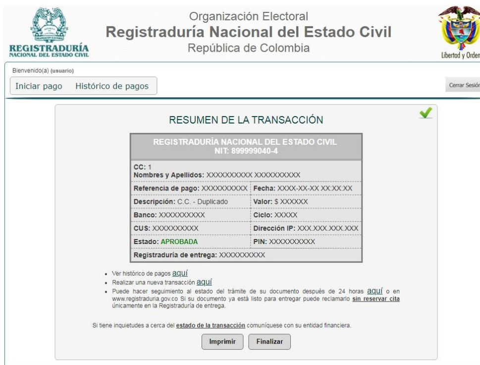
ILUSTRACIÓN 16. RESUMEN DE LA TRANSACCIÓN

Luego de realizar el pago deberá dar clic al botón “RETORNAR AL COMERCIO” para que sea retornado a la página web de la Registraduría Nacional, donde se mostrará el resumen de la transacción: