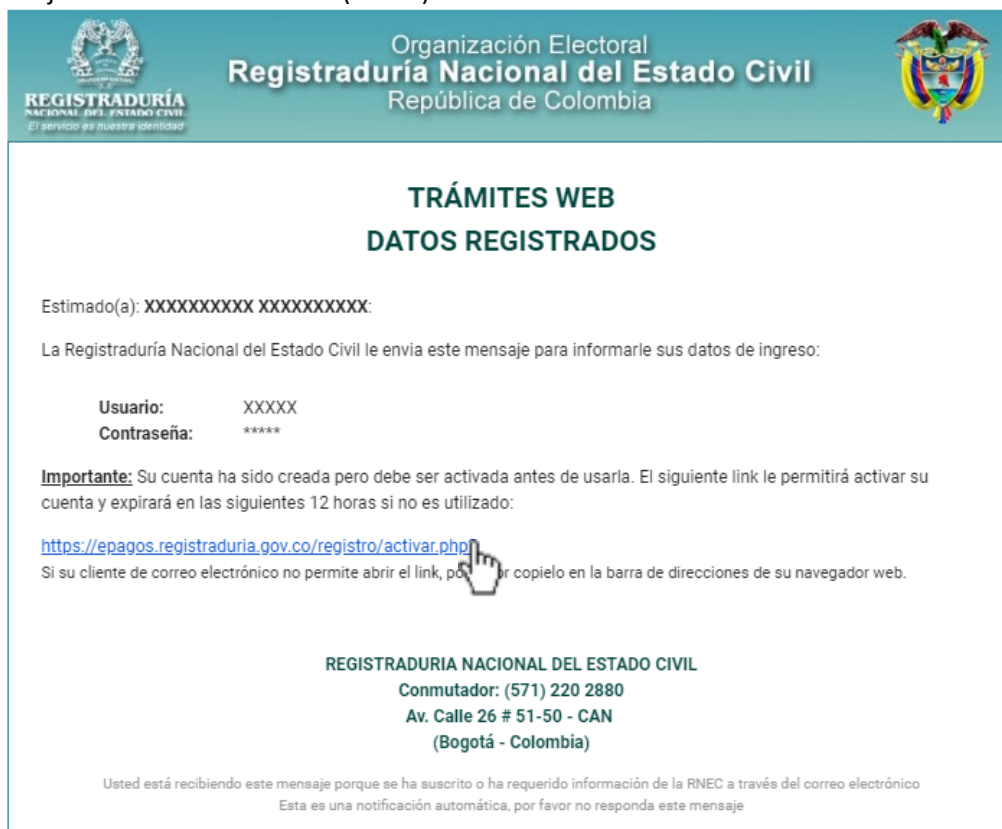
ILUSTRACIÓN 5. MENSAJE ENVIADO AL EMAIL

Se enviará un mensaje con el asunto: “Confirmación de Registro – RNEC” al correo electrónico registrado en el formulario para activar la cuenta para lo cual deberá revisar la bandeja de entrada o la bandeja de correo no deseado (SPAM):