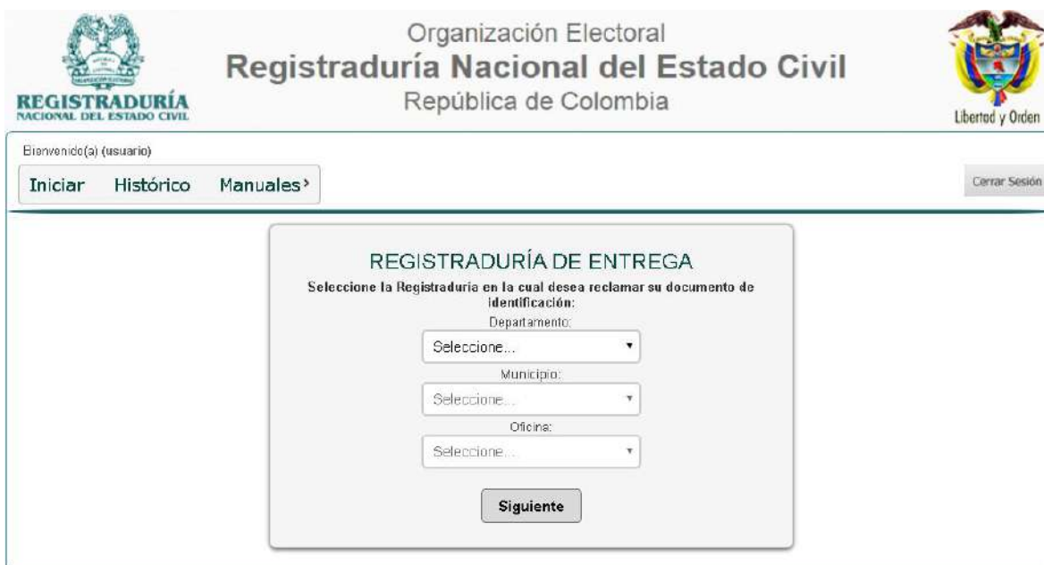
ILUSTRACIÓN 12. REGISTRADURÍA DE ENTREGA

Deberá seleccionar la Registraduría donde desea reclamar el duplicado del documento de identidad: