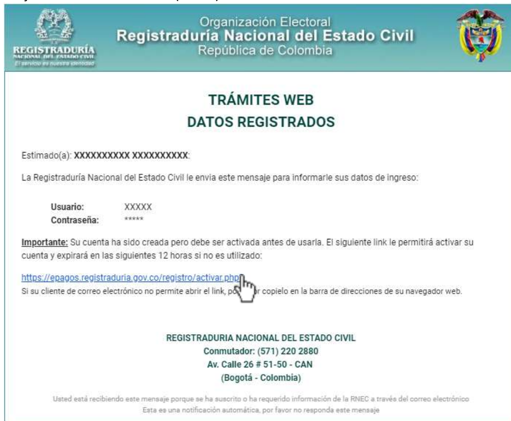
ILUSTRACIÓN 5. MENSAJE ENVIADO AL EMAIL

Se enviará un mensaje con el asunto: “Confirmación de Registro – RNEC” al correo electrónico registrado en el formulario para activar la cuenta para lo cual deberá revisar la bandeja de entrada o la bandeja de correo no deseado (SPAM):