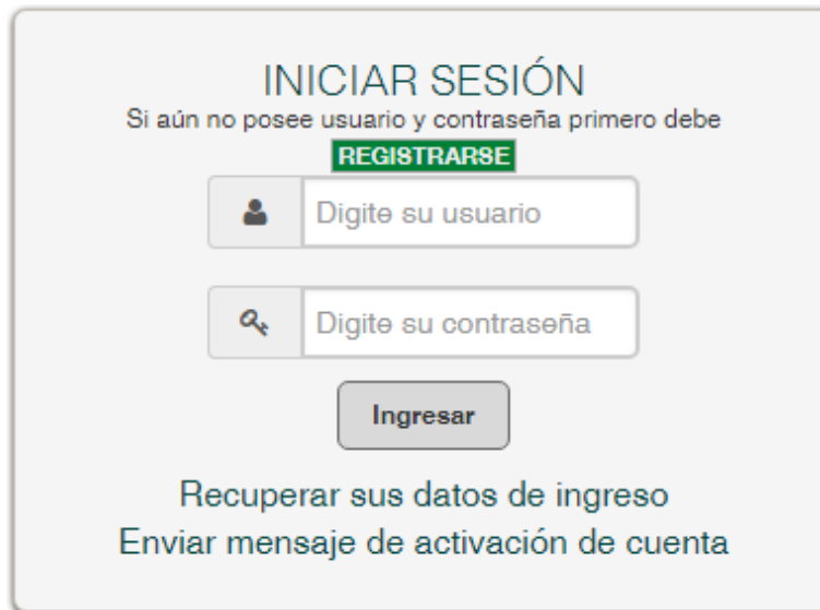
ILUSTRACIÓN 6. INICIAR SESIÓN

Podrá iniciar sesión con las credenciales de acceso, usuario (número de identificación) y contraseña, enviadas a la dirección de correo electrónico registrada: