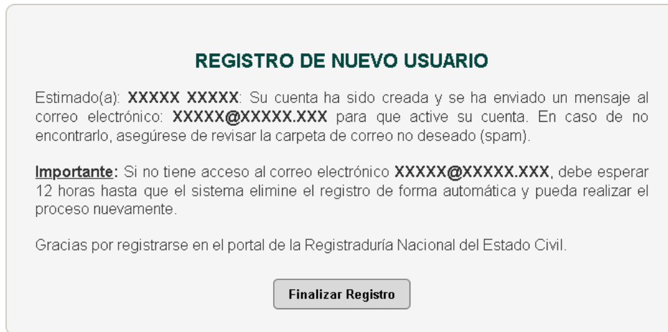
ILUSTRACIÓN 4. MENSAJE DE REGISTRO DE NUEVO USUARIO

Luego de que los datos sean registrados y validados por el sistema le aparecerá el siguiente mensaje: