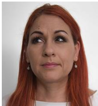
La mirada dirigida hacia un lado