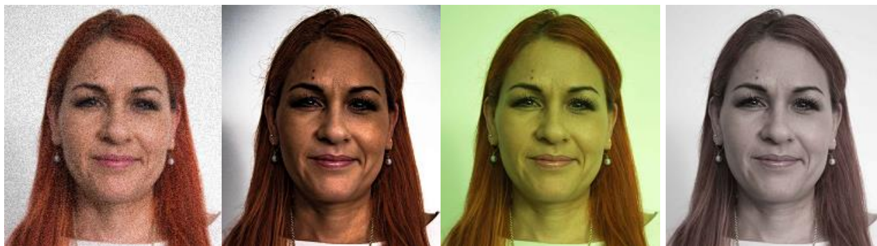
Visible estructura de los pixeles