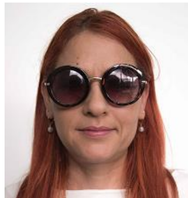
Anteojos de sol