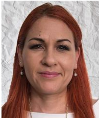
Fondo no liso