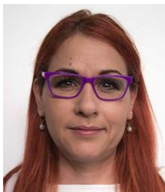
Los marcos demasiado gruesos