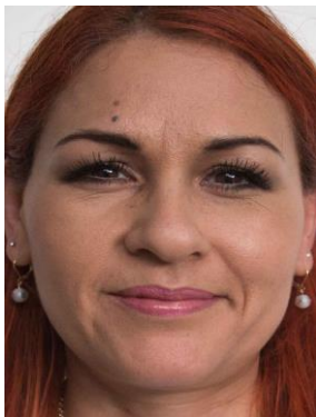
Cabeza demasiado grande