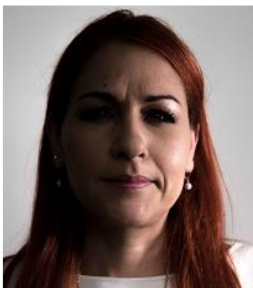
Sombra sobre el rostro