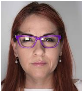
Reflejo en los anteojos