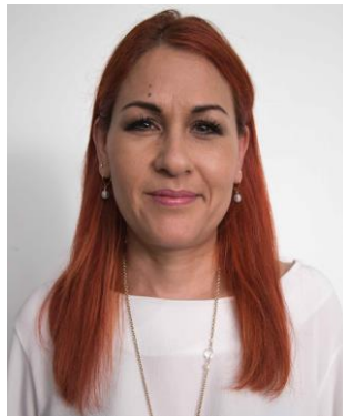
Cabeza demasiado pequeña