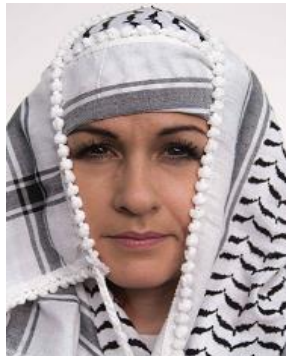
Sombras en el rostro