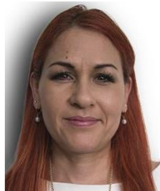
Sombras en el fondo

Nítidez y contraste: El rostro en todas las partes tiene que ser reflejado de manera nítida y con contraste adecuado. Es indispensable el uso de ropa oscura o de tonos fuertes para lograr contrataste en las fotografías, también se debe tener en cuenta que las fotos que lleven ropa con tirantas, cuellos grandes, figuras asimétricas o escotes pronunciados, que no permitan el contraste ya mencionado, no serán aceptadas o en su defecto deberán ser tomadas por el operador de Booking nuevamente.