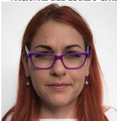
Los marcos cubren los ojos