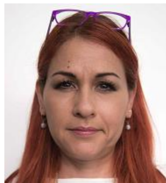
Anteojos sobre la cabeza

La cubierta de la cabeza: la persona fotografiada no puede tener la cabeza cubierta salvo que sea por razones religiosas, pero inclusive en esos casos el rostro entero (del mentón hasta el borde superior de la frente) tiene que ser bien visible, también será necesario que contenga los bordes de la cara no solo del lado derecho sino también del lado izquierdo.