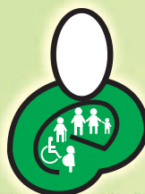
Servicio al ciudadano