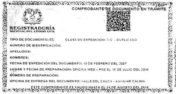
Figura 2. Comprobante de trámite de documento de identidad – Verde con código de verificación QR.

Corolario de lo expuesto se les solicita a las diferentes entidades públicas como privadas a nivel nacional, aceptar y validar como de comprobante de trámite los tres (3) tipos de contraseñas de cedula de ciudadanía y tarjetas de identidad expedidos por parte de la Registraduria Nacional del Estado Civil.